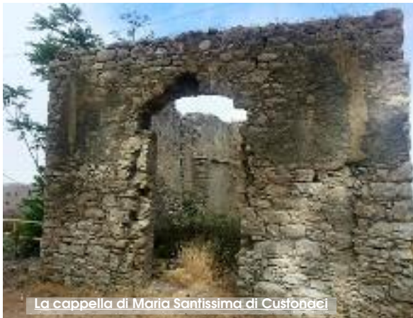
La cappella di Maria Santissima di Custonaci

È stato pubblicato il bando per l'affidamento dell'appalto dei "Lavori di recupero e miglioramento urbano di Erice Capoluogo" per l'importo complessivo di un milione e 120mila euro. Si tratta di una serie di interventi mirati al recupero del centro storico di Erice per il quale l'amministrazione comunale aveva ottenuto un finanziamento nell'ambito del programma regionale per la promozione di interventi di miglioramento della qualità della vita e dei servizi pubblici nei comuni siciliani.