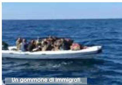
Un gommone di immigrati

Nella stessa posizione, ma con esclusione dei sospetti di radicalizzazione, un altro cittadino tunisino sbarcato con Ben Kraiem lunedì scorso: Sefi Achref, 29 anni, espulso da Milano nel 2015 perché ritenuto responsabile di una serie di