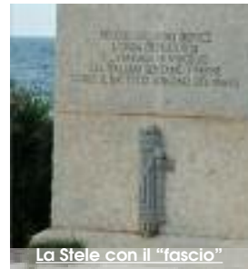
La Stele con il "fascio"