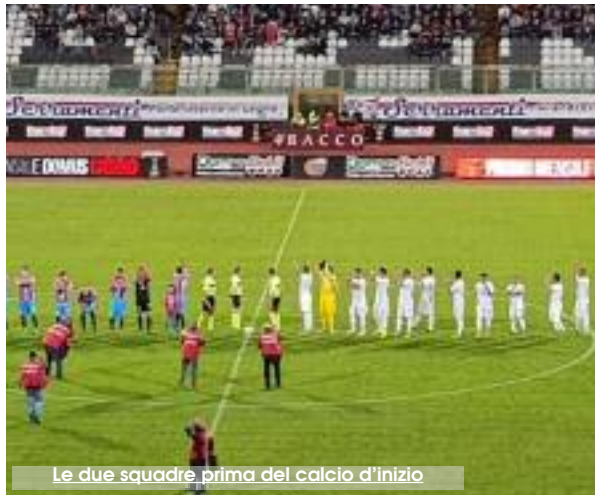
Le due squadre prima del calcio d'inizio