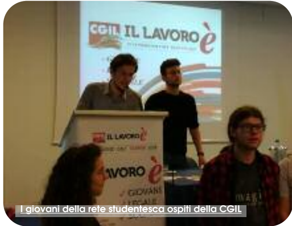
I giovani della rete studentesca ospiti della CGIL

Il IX congresso della Camera del Lavoro di Trapani ha lanciato una serie di segnali. Sintetizzati nel tema congressuale « il lavoro è: giovane, legale, solidale ». A dare un segno tangibile dell'orientamento e della rotta della Cgil è stata la presenza e l'intervento, in apertura dell'assemblea, dei giovani della Rete degli Studenti di Trapani, portatori di istanze che riguardano la scuola e il diritto allo studio e, senza retorica, i più interessati a capire che futuro si dovranno attendere in relazione ai cambiamenti imposti al mondo del lavoro dalla moderna economia globalizzata. Al di là dell'esito finale, ormai nota alle cronache, che ha visto la riconferma di Filippo Cutrona alla guida del sindacato, c'è da registrare l'alta partecipazione al dibattito congressuale: ventuno interventi. Tornano alla memoria i congressi di partito, quando il confronto democratico era vero, sentito, serrato e dirimente di posizioni. Il congresso è stato anticipato da 124 assemblee di base nei luoghi di lavoro e nelle 23 Camere del Lavoro distribuite nella provincia. Più di 7mila iscritti, un terzo dei quasi 22mila tesserati CGIL, ha preso parte al dibattito e al confronto interno. L'altro segnale: un sindacato vivo, che discute al suo interno, come non si fa più in ciò che è rimasto dei partiti, anche quelli