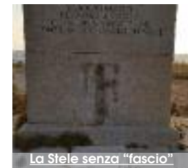
La Stele senza "fascio"