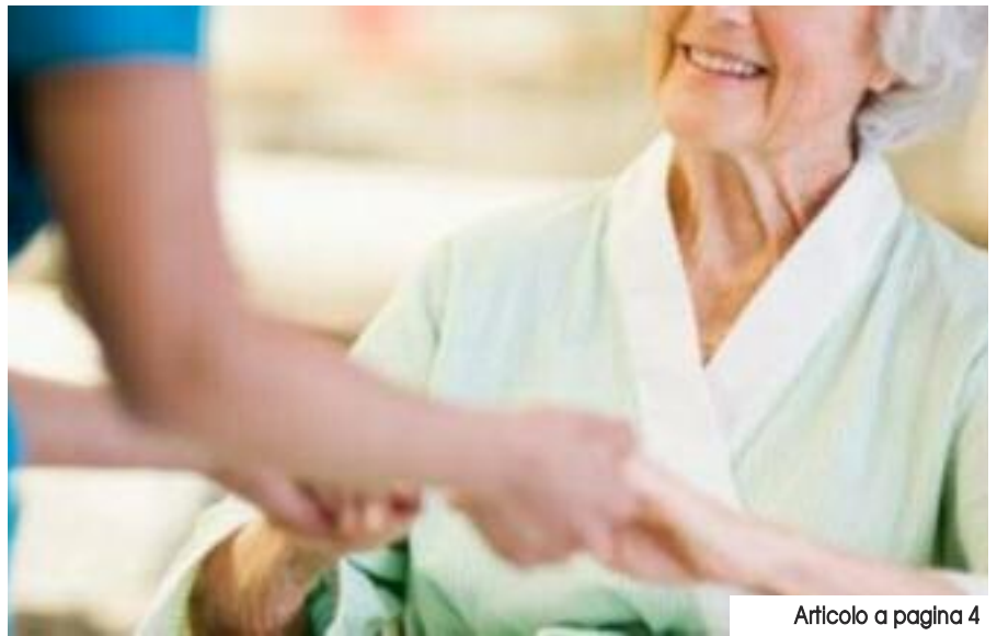
Articolo a pagina 4