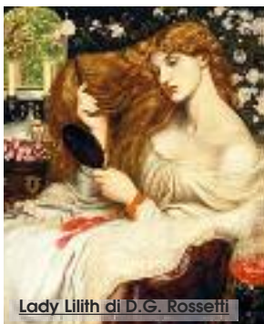
Lady Lilith di D.G. Rossetti

Dante Gabriel Rossetti, poeta, pittore inglese, nacque a Londra nel 1828. Fu uno dei fondatori della confraternita preraffaellita, lo scopo del movimento fu quello di contrastare l'accademismo vittoriano ufficiale, e reinterpretare la visione e il candore mistico del XV secolo. La sua pittura trova espressione nelle figure femminili, alte, pallide, snelle eroine e in creature perverse in un miscuglio di sensualità e inquietudine. Spesso riproduceva il fisico e i tratti di Elizabeth Siddall, musa, amante, e infine moglie dell'artista. Le figure inerti non esprimono emozione, cosicché il senso rimane oscuro, come se fosse nascosto tra i densi tratti della pittura. Alcune opere di Rossetti si trovano alla Tate Gallery di Londra. Infine, gli artisti preraffaelliti esercitarono un notevole influsso sulle future correnti artistiche del tardo '800, dall'art nouveau al sim-